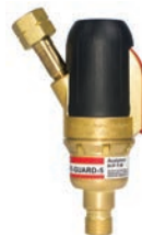
ANTI-RETOUR DE FLAMME 5 FONCTIONS GCE SAFE-GUARD-5