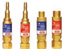
ANTI-RETOUR DE FLAMME 2 FONCTIONS GCE SAFE-GUARD-2